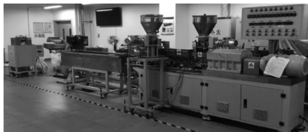
图1 双螺杆挤出机组