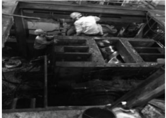
图4 主机现场拆机照片

主机整体拆除首先需要将与减速机连接的联轴器分开（见图4），同时检查联轴器内齿套和外齿套是否存在缺齿和点蚀的情况，如果存在的应及时和用户进行反映（因为联轴器一般在大修时是不更换）。然后将主机的地脚螺栓进行拆解，拆解下来的螺母及垫圈放置到一起，避免丢失影响后期安装。最后是将二次灌浆撬除，因为二次灌浆与主机底板之间的胶合力将导致在起吊瞬时重量过重出现无法起吊甚至钢丝绳断裂发生安全事故。同时再将下料口处与主机连接钢板割开、垫铁与主机点焊处剖开。