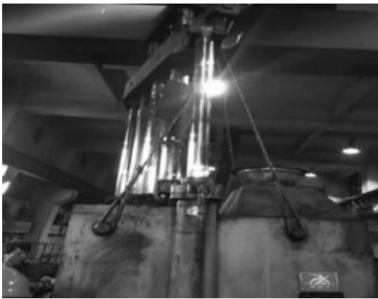
图3 加料筒起吊照片

加料筒的整体拆除（见图3）首先需要在水、电、压缩空气、油未断开前将压砣上升到最高位并插上安全销，因为压砣停留在最低位可能会导致起吊高度不够无法将压砣从主机口中吊出也可能因为起吊高度过高增加吊装风险。然后将与加料筒连接的上辅机下料筒、除尘装置、信号线进行断开拆除并做上有效标记并拍照存档。最后将与主机连接的连接螺栓进行拆除，同时检查是否有断掉的螺栓，如果存在就需要和用户的维修人员进行沟通，询问发生的当时情况和次数，方便后期的返厂大修时对此问题有针对性的解决。