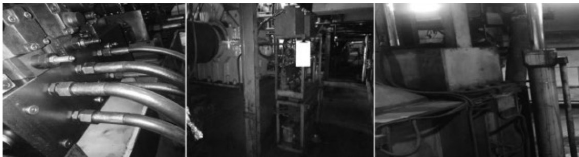
图2 现场原管路及线路位置图

第一，密炼机正常运转离不开水、电、压缩空气、油这四项（见图2）、所以在拆机时首先也需要将这四项都进行断开或者拆除。水是密炼机能够生产出合格的胶料的重要保证，它运转在混炼室、转子、压砣、卸料门之中，它能防止设备过热影响胶料的质量。断开与设备连接水管路同时又不能影响密炼车间的其他设备正常运转，这样就需要和用户的维修人员进行沟通，避免误关其他设备的水管路。并在管路上做上有效标记。断开设备的总共进水和总回水后，同时将设备内部水尽最大可能排空，避免在拆除设备附属管路水未排空导致现场地面积水影响后期的拆除工作；电是给设备提供动力，同时也是在拆除中会带来危险的。所以正式拆机的第一项工作就是断开主电源，避免出现误操作发生危险，同时也需要将密炼机与上下辅机连接的信号线断开，并且做上标记并拍照存档方便后期的恢复；压缩空气也是设备上部分功能提供动能的，也需要将设备上的气管路进行关闭并且做上标记并拍照存档；密炼机的运转过程中使用到工艺油、润滑油、润滑脂、液压油，它们都是也是通过管路与主机连接，因此需要将与设备连接的管路进行断开处理，同时要对每根管路进行标记并拍照存档，同时在断开处进行防尘保护处理，已便于后期安装调试恢复安装。