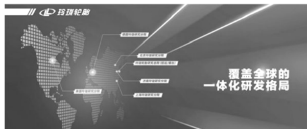
展望未来，持续助力汽车强国

玲珑轮胎紧跟汽车智能化、电动化、网联化的发展趋势，加大研发投入和产品创新力度。通过对低噪音、抗湿滑、超低滚阻、超高耐磨、补气保用、SEALIN自修复、LLST静音棉、智能芯片等产品系列的开发，玲珑轮胎持续为车企提供智能、低碳、舒适的轮胎解决方案。这些创新产品不仅提升了整车性能，也为消费者带来了更加安全、便捷的驾驶体验。