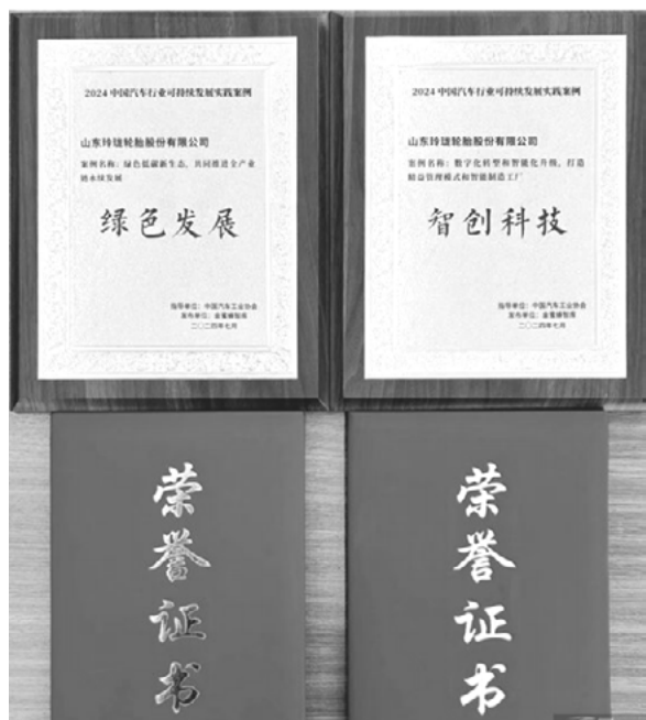
绿色发展，引领行业新风尚

日前，由中国汽车工业协会指导，金蜜蜂智库发起的“2024 中国汽车行业可持续发展实践案例”评选活动圆满落幕。玲珑轮胎凭借其卓越的绿色发展理念和智创科技实力，在众多参评企业中脱颖而出，荣获“绿色发展”和“智创科技”两项殊荣。